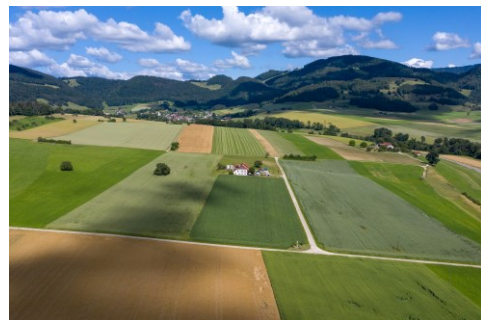
Situation idéale pour une comptabilité analytique et l'analyse des marges brutes comparables des cultures.

D'autre part, les licences WinbizAgro ne seront plus proposées par le fournisseur dès 2024, un important défi sera donc d'opter pour de nouveaux logiciels métier adaptés à nos besoins et le plus sécurisés possibles.