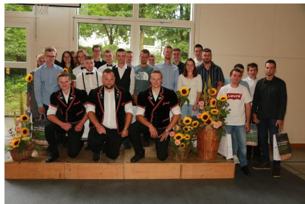
Quelques-unes des diplômées CFC Ecole des métiers et de l'intendance et Quelques-uns des diplômé-e-s CF Agricoles

Nous remercions sincèrement nos partenaires pour leur soutien et leur implication, ainsi que les clients de la FRI pour leur confiance renouvelée. Nous remercions les cantons du Jura et de Berne pour leur importante contribution au financement de nos activités et pour leur participation active aux côtés des chambres d'agriculture du Jura et du Jura bernois pour le bon fonctionnement de l'institution.