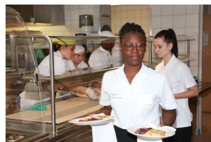
Une formation répondant aux attentes du marché du travail

Au niveau national, l'arrivée des nouvelles professions et formations de Gestionnaire (CFC) et Employé-e (AFP) en hôtellerie et intendance dès 2024 constituent un nouveau défi et offre également des opportunités. L'EMI se prépare d'ores et déjà à mettre en place la nouvelle formation, qui sera dispensée dès la rentrée 2024. Cette évolution offre également des opportunités avec l'accès au marché du travail dans le secteur de l'hôtellerie. La profession et l'EMI devront travailler de concert pour créer de nouvelles places d'apprentissage et par la suite des places de travail. Il y a également lieu de profiter de cette nouvelle situation pour retravailler l'image de la profession auprès des jeunes et du public.