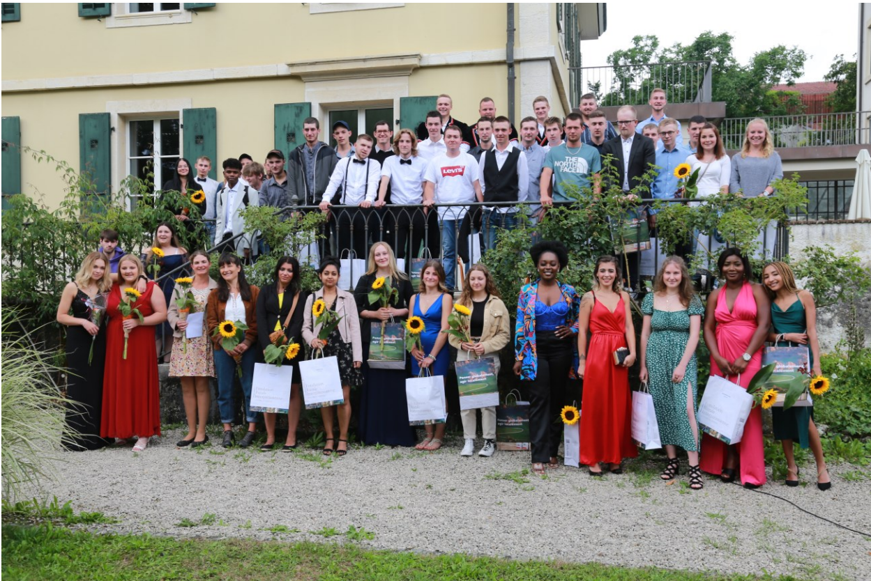
Diplômé-e-s FRI 2022 de la cérémonie de remise des diplômes