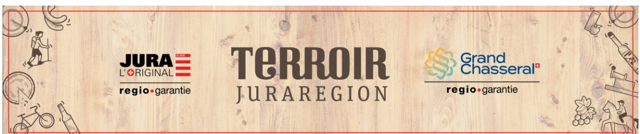
Terroir Juraregion et les deux nouvelles marques régionales (réalisée par l'agence Annick & Yannick)

Assurer le déploiement des deux nouvelles marques et l'adhésion de l'ensemble des parties prenantes derrière ces démarches collectives.