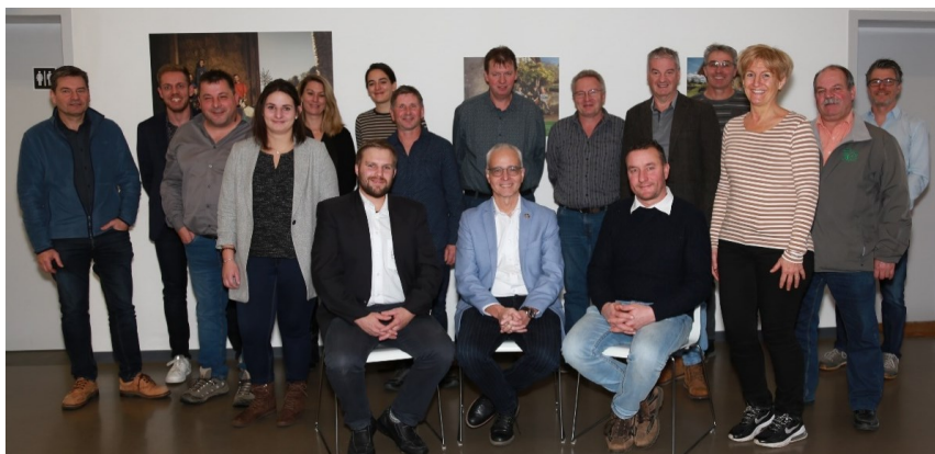
Conseil de fondation en 2022 : il comprend 15 membres et gère l'institution.

La dernière séance, s'est terminée par la photo ci-dessous et par la présentation des collaborateurs-trices engagé-e-s durant l'année 2022.