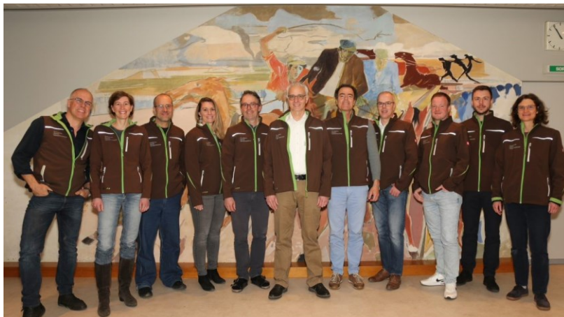
Equipe de direction fin 2022, composée de 12 membres