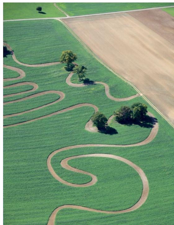
La gestion, un domaine dans lequel il faut prendre du recul !

Un des défis pour l'avenir sera d'utiliser les moyens techniques à disposition, notamment en lien avec la mise en valeur des données, pour fournir une dimension plus dynamique à la lecture des résultats de l'entreprise. Cela permettra entre autres de renforcer le lien entre le conseil agricole et le domaine de la fiduciaire, ce qui serait un vrai plus pour la profession. Un tel accès facilité à la présentation des résultats permettrait également d'effectuer davantage d'analyses de coûts de production, et d'offrir ainsi aux agriculteurs de la région une meilleure vue d'ensemble du fonctionnement de leur entreprise.