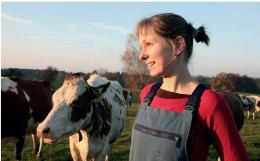
Affronter les défis de la durabilité avec enthousiasme.

Le domaine s'efforce d'élaborer des savoir-faire et des outils performants et innovants, afin de pouvoir accompagner au mieux les familles paysannes qui font face à d'énormes défis. En effet, les élevages doivent fournir du lait et de la viande pour nourrir une population exigeante, tout en étant en harmonie avec l'environnement et rentables !