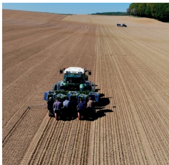
Plantation de betteraves sucrières bio.

La production biologique suisse se trouve dans un délicat équilibre entre l'offre et la demande. Malgré une croissance persistante, les produits bio ne représentent que 11% du chiffre d'affaire des denrées alimentaires, le potentiel de développement est donc encore très important. Il s'agit avec cette nouvelle stratégie, de maintenir le rythme des reconversions à l'agriculture bio des cinq années écoulées, mais également de donner de nouvelles impulsions au niveau sociétal pour une consommation accrue de produits bio. Cette nouvelle stratégie 2021-2025 permet, dans un juste équilibre, de développer la production mais surtout la consommation régionale de produits bio, tout particulièrement dans la restauration collective, les cantines et dans les circuits courts (vente à la ferme, marchés et commerces de proximité). Cet environnement favorable devrait permettre la poursuite du développement de l'agriculture biologique et les fermes bio devraient ainsi représenter le tiers des exploitations du Jura et du Jura bernois d'ici 2030.