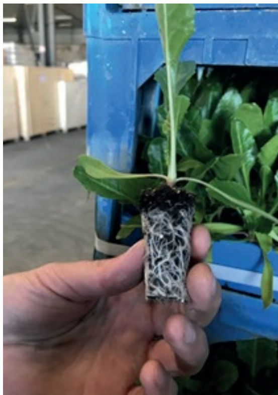
Robotique dans la mise en place de la betterave ; potentiel pour le repiquage versus semis.