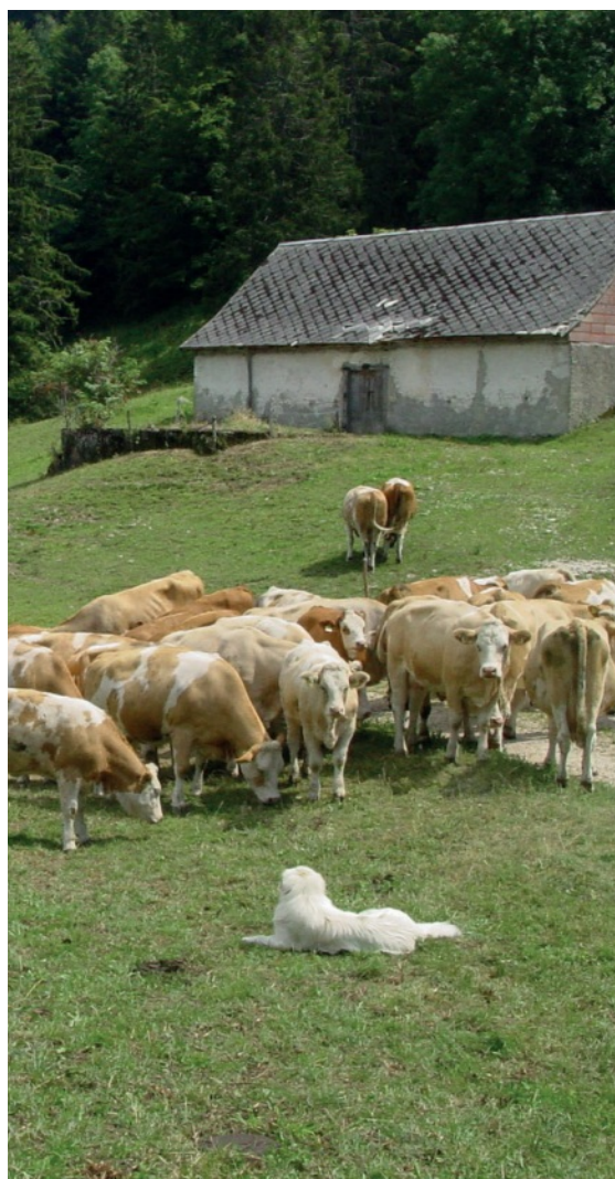
Le conseil pour le soutien de l'agriculture de notre région.