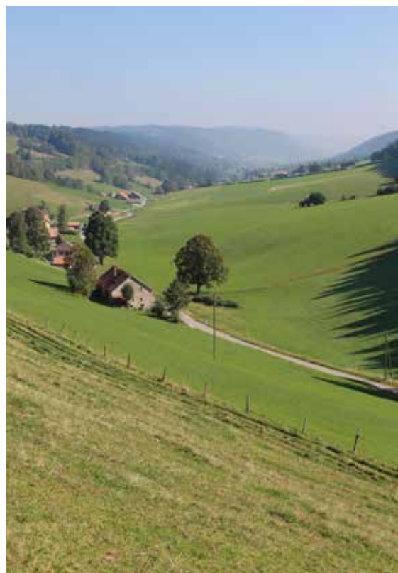
Les Convers BE