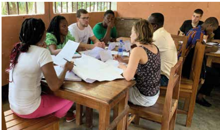
Échange entre agriculteurs suisses et africains au Cameroun, Institut Agricole d'Obala (IAO).

P roduire suffisamment de denrées de qualité pour assurer une souveraineté alimentaire adéquate, préserver les ressources naturelles, garantir l'innocuité des pratiques agricoles pour la santé et l'environnement, faire face aux aléas du changement climatique et maîtriser un contexte politique et économique en constante évolution sont autant de défis que l'agriculture doit relever au quotidien. Nul doute qu'une solide formation professionnelle et continue s'avère essentielle dans cette perspective.