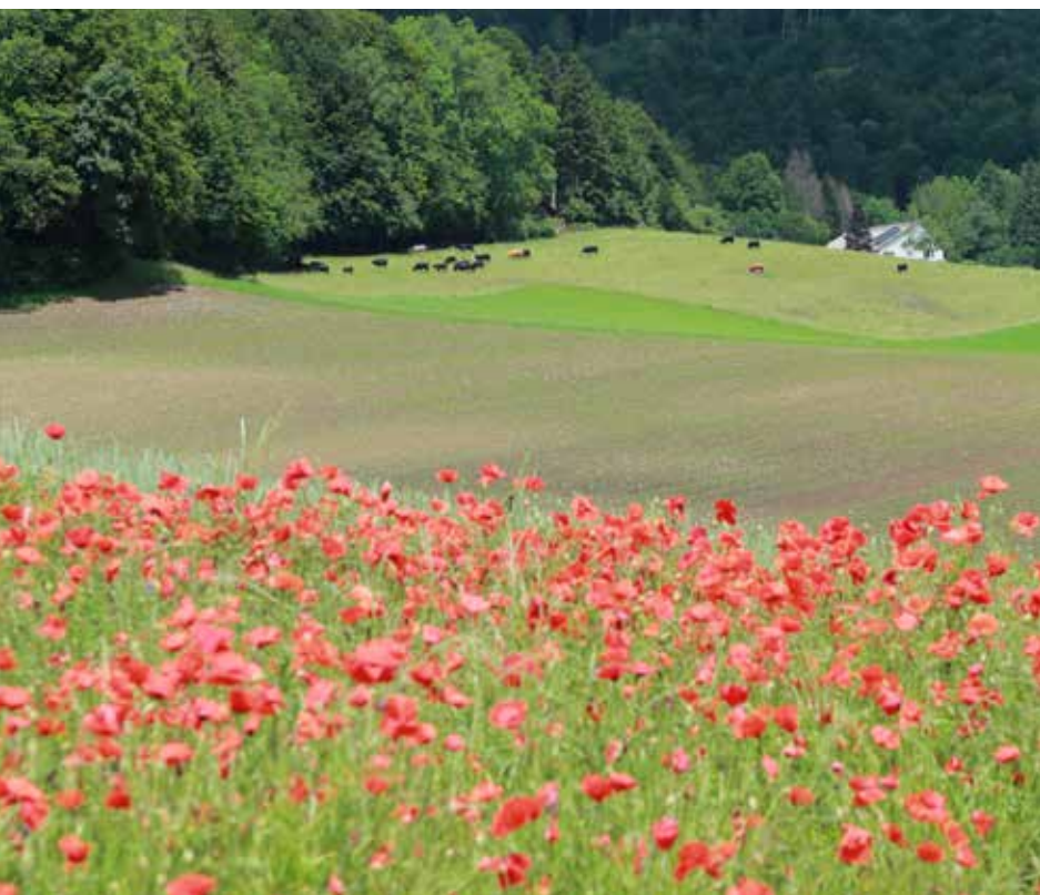
Develier-Dessus JU et Renan