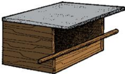
Nichoir à faucon crécerelle