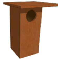
Nichoir à chouette hulotte