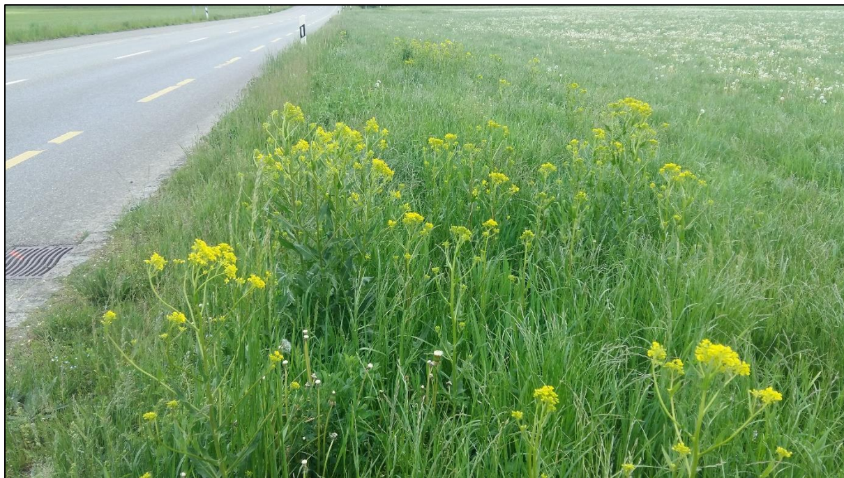
foyer de Bunias d'orient en bordure de prairie temporaire.

Cette espèce d'origine caucasienne se propage actuellement sur de vastes territoires d'Europe centrale et d'Europe de l'est. Dans les exploitations agricoles, elle envahit durablement les surfaces, devient dominante et concurrence la végétation typique de ces milieux. Du fait de son odeur désagréable, le bétail l'évite. Elle réduit la qualité fourragère, que ce soit celle du fourrage frais ou conservé. Elle n'est pas toxique cependant.