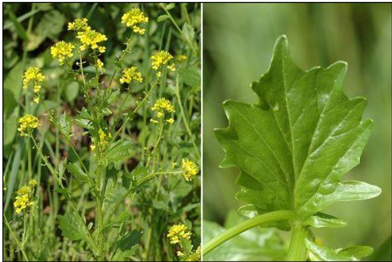
tiges fleuries et feuille à aspect brillant de la barbarée.

Nom(s) : Barbarea vulgaris ; Herbe de Sainte-Barbe ; Gemeine Winterkresse