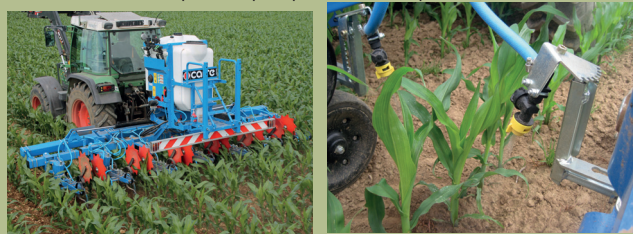
Figure 2 : Système de pulvérisation localisée sur le rang couplé à un binage sur l'interrang

Le traitement plante par plante n'est pas autorisé.