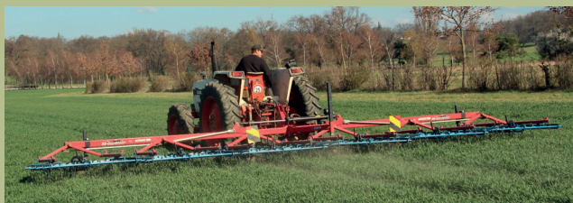
Figure 1 : Herse étrille à grande largeur

A En cas de non-recours total aux herbicides, aucun herbicide ne doit être utilisé sur 100% de la surface annoncée.